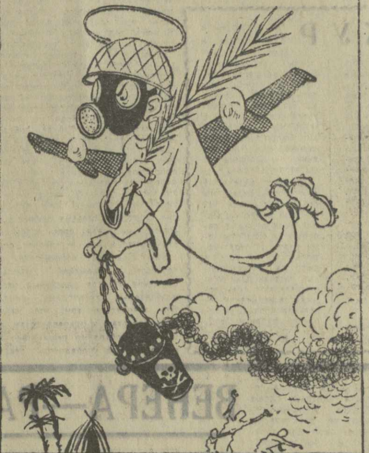
ПЕНТАГОНСКИЙ «АНГЕЛ-ХРАНИТЕЛЬ» ЗА РАБОТОЙ. Рис. засл. художника Грузинской ССР А. Канделаки.

НЬЮ-ЙОРК, 30 марта. (ТАСС). Сильный взрыв потряс сегодня утром посольство США в Сайгоне. В результате взрыва, который произошел в нескольких метрах от здания и был слышен разом от осколков разбитого стекла и кирпичей, нанесен значительный ущерб. Согласно сообщениям американских информационных агентств, по предварительным данным, в здании посольства находилось до 150 человек, и получили ранения около 10 человек. Взрывом повреждены также несколько автоматов, стоявших перед зданием посольства.