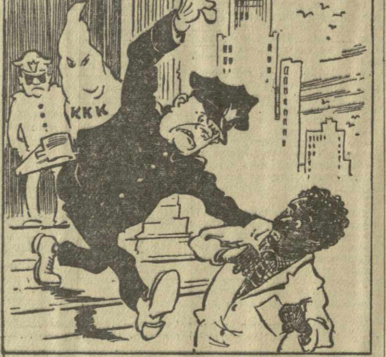
Американская избирательная система в действии. Рис. А. Канделаки.

Американские расисты в г. Селма подвергли насилию негров, желающих зарегистрироваться в качестве избирателей. (Из газет).