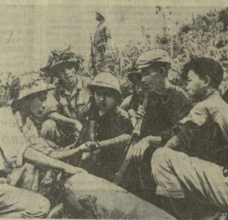
Американские агрессоры применяют во Вьетнаме самые жестокие и бесчеловечные методы ведения войны, не останавливаясь перед применением газов, отравляющих химических веществ, напалмов и фосфорных бомб. Самолеты США сбрасывают на населенные пункты Демократической Республики Вьетнам бомбы замедленного действия, в надежде уничтожить как можно больше людей. Эти уловки врага разлагаются. Нераспоразимые бомбы быстро обезвреживаются. На снимке: боец вьетнамской Народной армии показывает бойцам народной милиции, как разрезать бомбы замедленного действия.

Все страны Африки, все миролюбивое человечество, отмечает «Нгумо», выражают солидарность с мужественной борьбой патриотов Вьетнама и требуют немедленно прекратить американскую агрессию во Вьетнаме. (ТАСС).