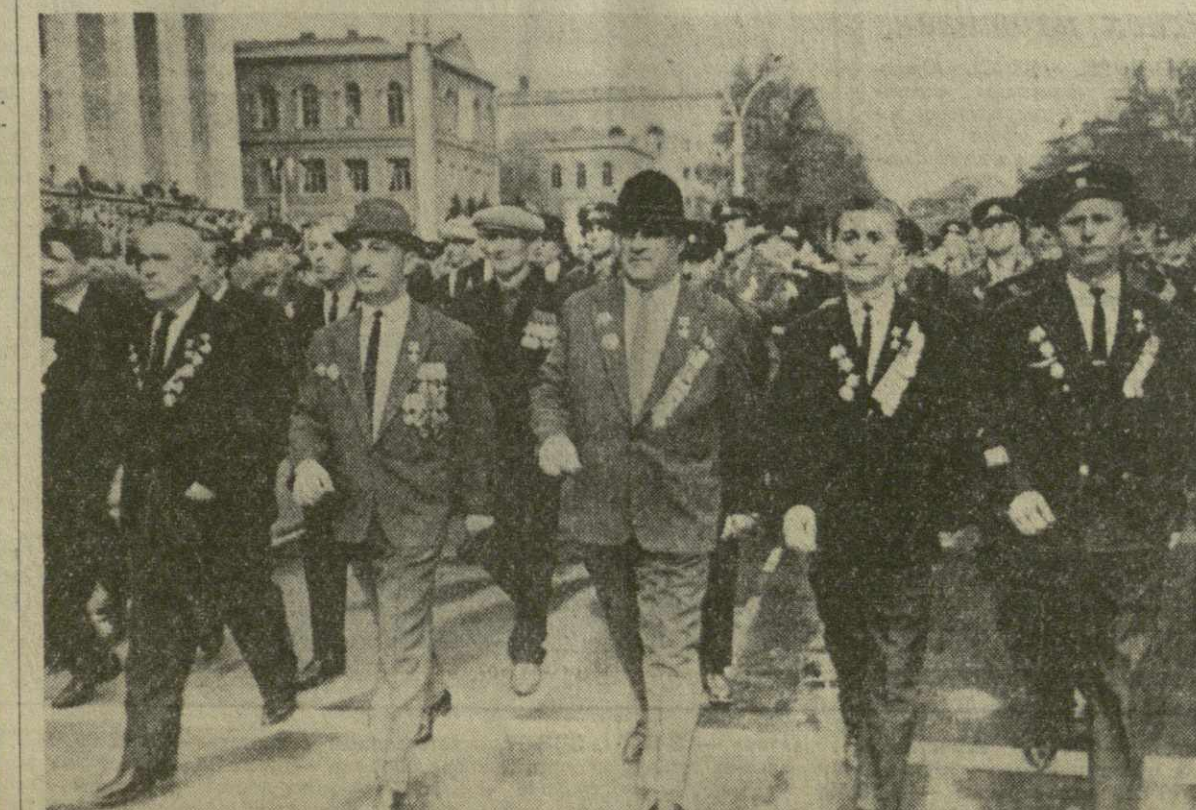
Тбилиси. 9 мая 1965 года. Военный парад на проспекте Руставели в честь Дня Победы. На снимке: идут ветераны Великой Отечественной войны.

Руководители партии и правительства республики возложили венки на братскую могилу, минутой молчания почтили светлую память советских воинов. (ГрузТАГ).