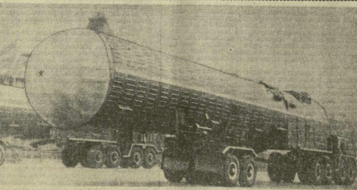
МОСКВА, КРАСНАЯ ПЛОЩАДЬ, 9 МАЯ 1965 ГОДА. Военный парад в ознаменование 20-й годовщины победы советского народа в Великой Отечественной войне. На снимке: гигантские орбитальные ракеты. Они срываются с космодрома, уверенно выходя на орбиту космических кораблей-спутники — «Восток» и «Восход». Для этих ракет не существует границ дальности полета, а возможная мощность ядерных боеголовок фантастична. Главной особенностью ракет этого класса является способность поражать объекты противника буквально с любого направления. Это делает их практически неуязвимыми от средств противоракетной обороны.

Указом Президиума Верховного Совета СССР от 8 мая 1965 года награждены орденами и медалями СССР отличившиеся в боях с немецко-фашистскими захватчиками офицеры, сержанты и рядовые войск и органов госбезопасности в количестве 1.632 человек. Орденом Ленина награждены четыре чекиста, выполнявших специальные задания в тылу противника, орденом Красного Знамени — 18, орденом Отечественной войны I степени — 125, орденом Отечественной войны II степени — 279, орденом Красной Звезды — 397, орденом Славы III степени — 13, медалью «За отвагу» — 295, медалью «За боевые заслуги» — 501 человек.