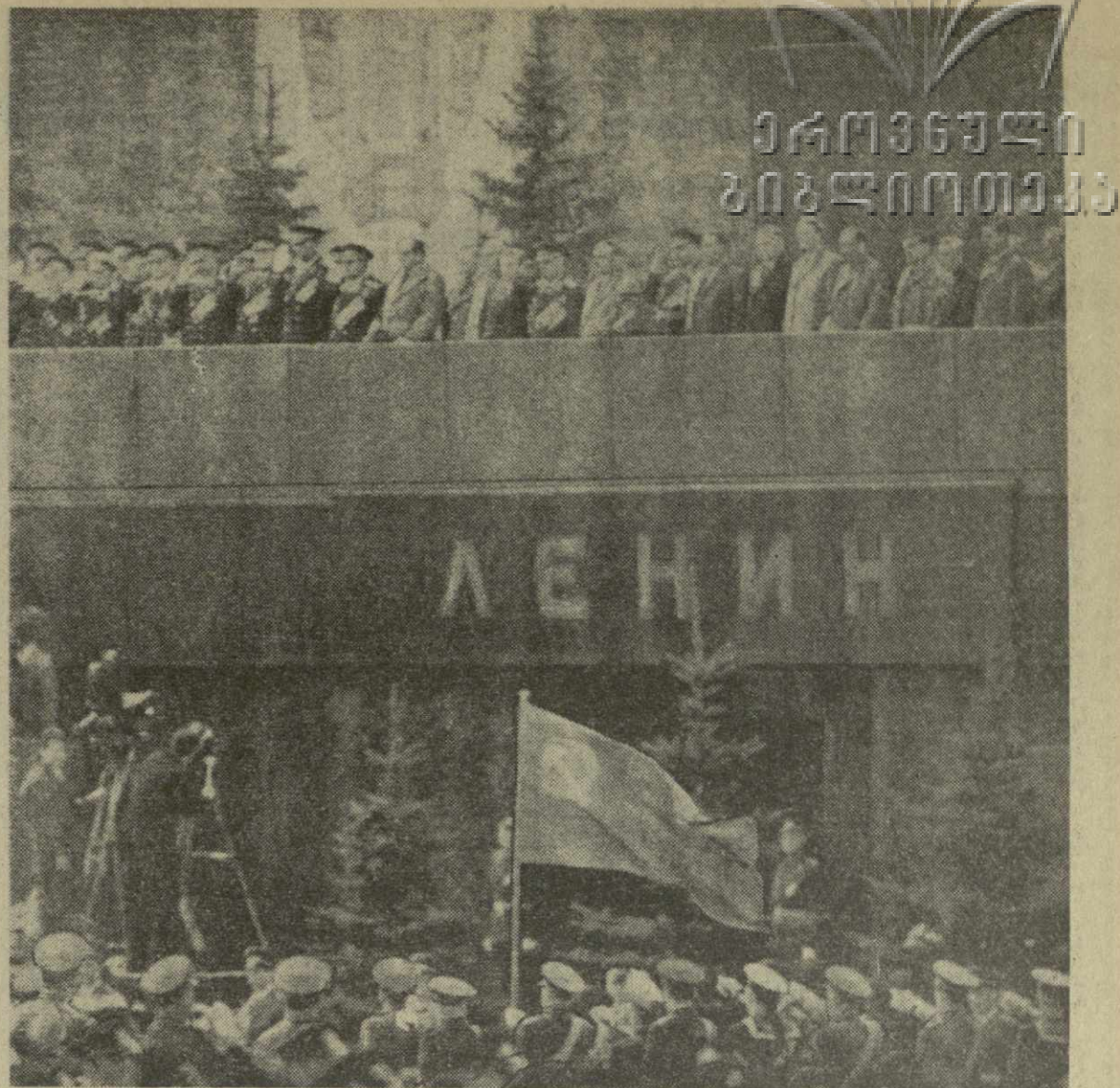
МОСКВА, КРАСНАЯ ПЛОЩАДЬ. 9 МАЯ 1965 ГОДА. Военный парад в ознаменование 20-й годовщины победы советского народа в Великой Отечественной войне. На снимке: Знамя Победы у Мавзолея В. И. Ленина. Фотохроника ТАСС. (Принято по фототелеграфу ГрузТАГА).