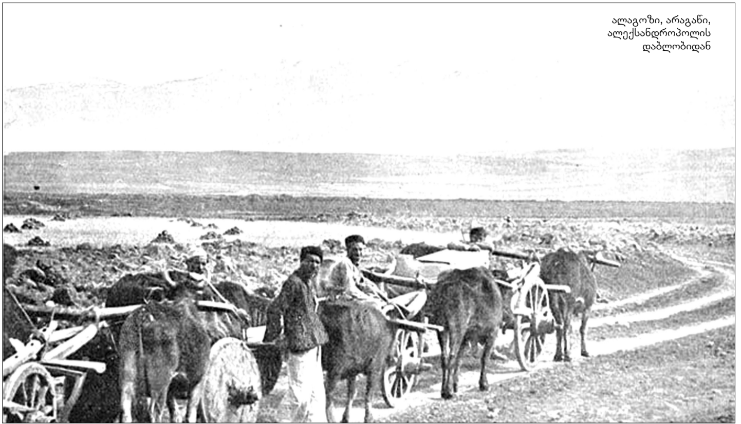
ალაგოზი, არაგანი, ალექსანდროპოლის დაბლობიდან

წამომართული ზეგნები, კორდების ბუნებრივი ხალიჩა, რომელსაც დახსული