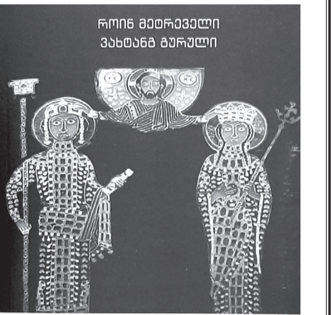
საპარტიკოლო საბარაქო-პოლიტიკური ორიენტაციის შუა საუკუნეები (IV-XVIII სს.)