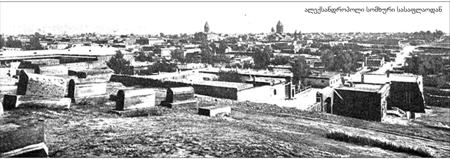
ალექსანდროპოლი სომხური სასაფლაოდან

მაგრამ ამ შედარებით მსუბუქი კონტურების ფარგლებში იდეალური ლანდშაფტი გადაშლილიყო, რომელიც დამახასიათებელი იყო ზეგანის ყველაზე შემადლებული ადგილებისათვის. შედარებით ვაკე ადგილები ტალღოვანი იყო, გორაკები და მათი ფერდობები კი ტორფით მო-