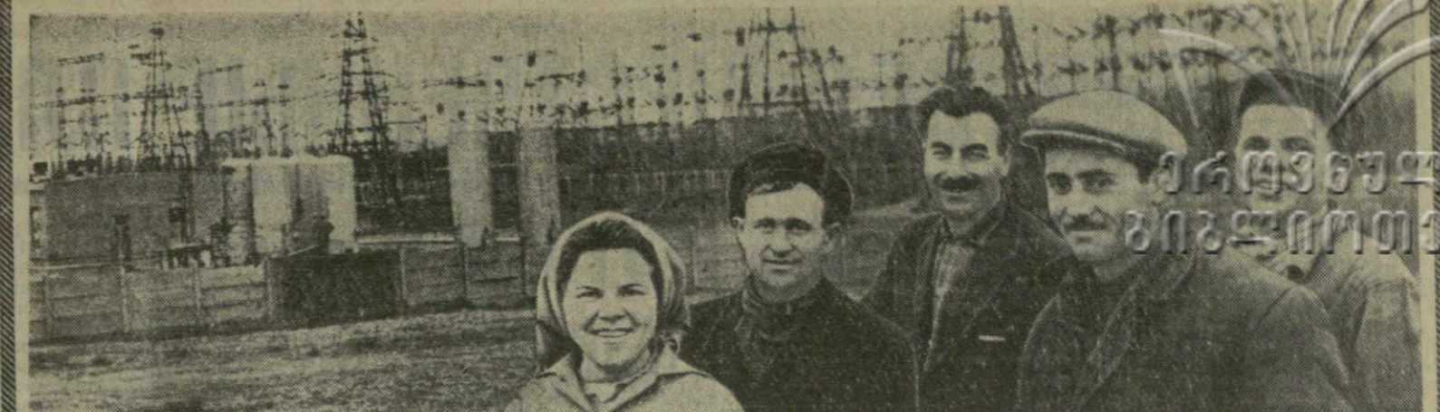
В проекте Директив XXIII съезда КПСС по пятилетнему плану развития народного хозяйства страны на 1966—1970 годы намечено довести мощность Тбилисской ГРЭС до 960 тысяч киловатт. Сейчас на строительстве полным ходом идут работы по расширению этой крупнейшей электростанции нашей республики.

№ 62 (12606) Четверг, 17 марта 1966 года Цена 2 коп.