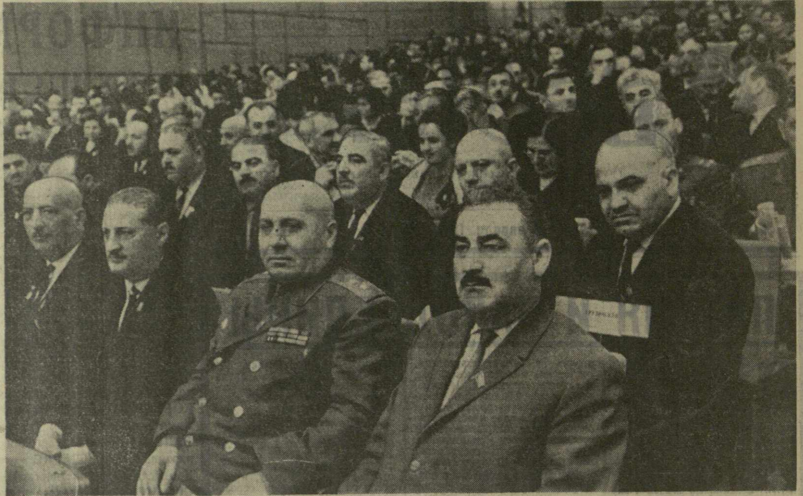
Москва. XXIII съезд Коммунистической партии Советского Союза. На переднем плане — делегация Грузинской ССР.

Наша партия осуждает любую деятельность, наносившую ущерб единству действий внутри великой семьи коммунистов. Мы согласны с Отчетным докладом ЦК КПСС, в котором говорится, что для сплочения коммунистических рядов существует хорошая марксистско-ленинская платформа — генеральная линия, выработанная со-