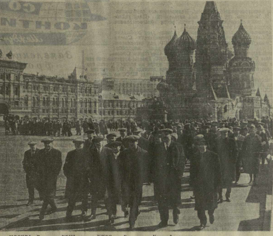
МОСКВА. Делегаты XXIII съезда КПСС из Грузии на Красной площади.

— Для империализма XXIII съезд — источник беспоконья, — говорит он, — для народов — источник доверия и надежды. Прогрессивные силы Мартиники,