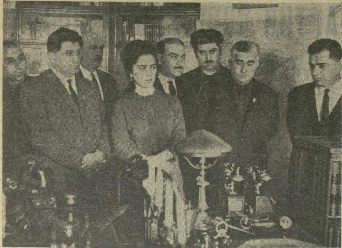
Москва, Кремль. Делегаты XXIII съезда КПСС из Грузии осматривают рабочий кабинет В. И. Ленина в Кремле.