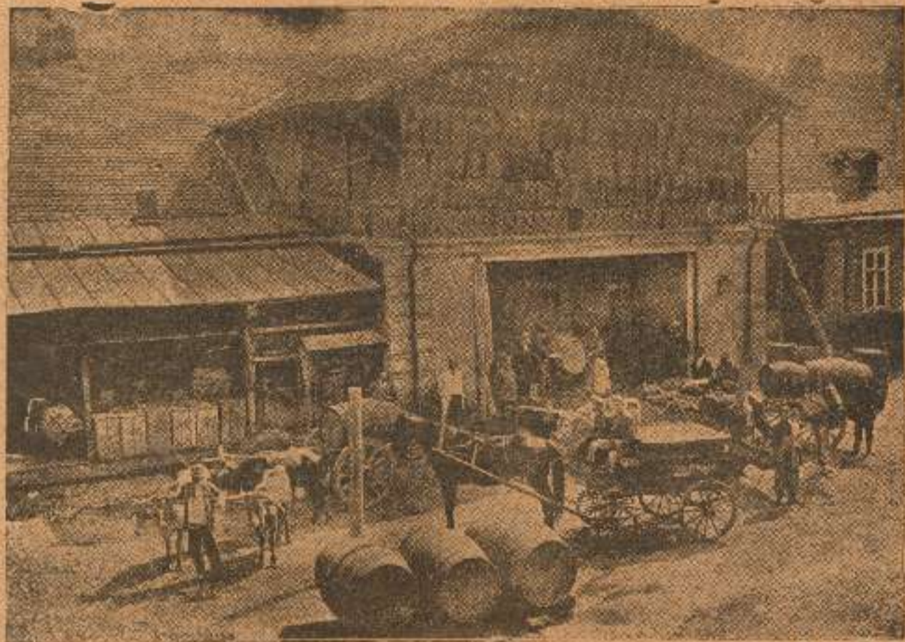
ეზო საზოგადოება „კახეთისა“: ღვინის მოტანა და გატანა

საზოგადოებას 15 წლის განმავლობაში გაუყიდა 1,000,000 ვედრო ღვინო 3,000,000 მან.