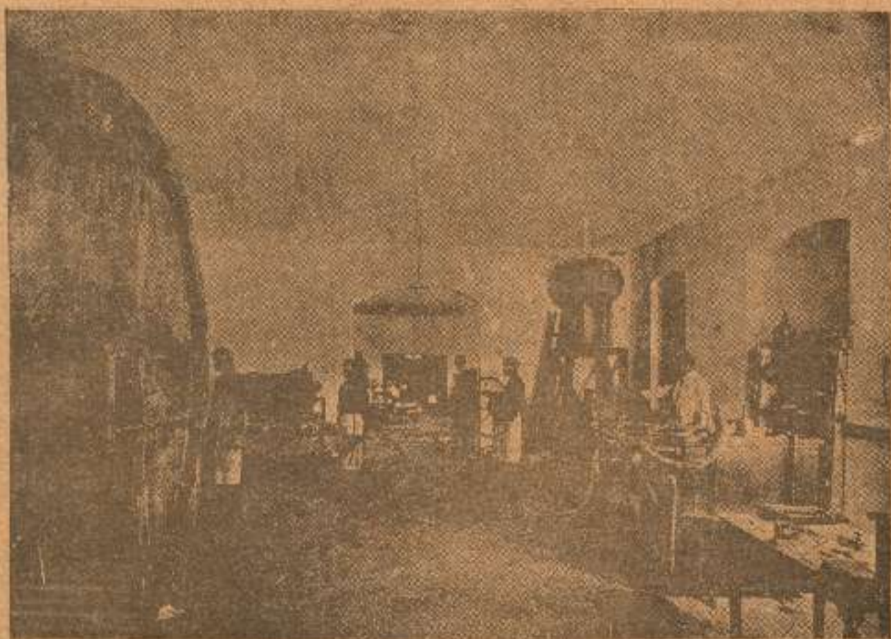
სარდაფი „კახეთისა“: ღვინის გადაღებ-გადმოღება

საზოგადოებას აქვს განყოფილებანი: ბაქოში, ასხაბადში, ტაშკენტში, ბათუმში, მოსკოვში, არმავირში, ალექსანდრპოლში, ეკატერინოდარში.