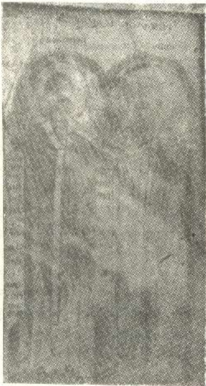
იოანე მტბევარი და ბასილი კესარიელი

მიქაელ მოდრეკილის კრებულს, რომელსაც დაუცავს იოანე მტბევარის ნაწარმოებნი, — დაუცავს მისი სურათიც, რომელიც უდიდეს განძად უნდა ჩაითვალოს: ეს არის ერთად ერთი ნამდვილი, თანამედროვე სურათი ძველ-ქართველ მწერლისა.