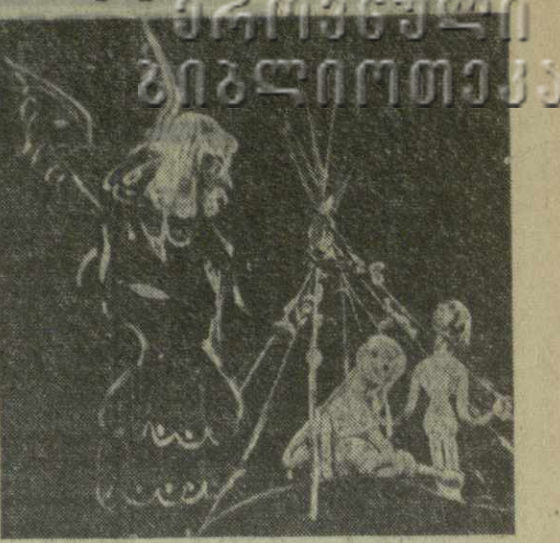
Такти театра такими популярными. В добрый час, дорогие друзья! Тбилисский зритель ждет встречи с вашим необыкновенным искусством.

Юмор, острое слово, обаяние улыбки и, конечно, непревзойденное мастерство артистов-кукольников — вот что делает спек-