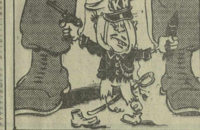
ОБРАЗЦОВАЯ КУКЛА ПЕНТАГОНА. (просьба не путать с куклами С. Образцова). Рис. А. Кандакаки.

Газета «Острэлиан» пишет в этой связи, что как сессия совета СЕАТО, так и предстоящие переговоры австралийского премьера Холта в Вашингтоне и Лондоне повлекут за собой посылку во Вьетнам новых контингентов австралийских войск.