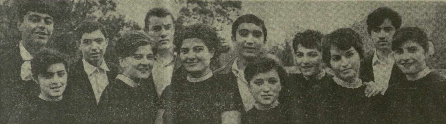
Всем классом на производство — так решили десятиклассники 75-й тбилисской средней школы...