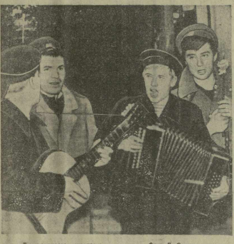
«Так начинается спектакль...»

Спектакль «Десять дней, которые потрясли мир», в Московском театре драмы и комедии. Что чувство ритма и пластической образности у режиссера сливается с ритмической манерой и чувством пластики у балетмейстера (Н. Авалиани).