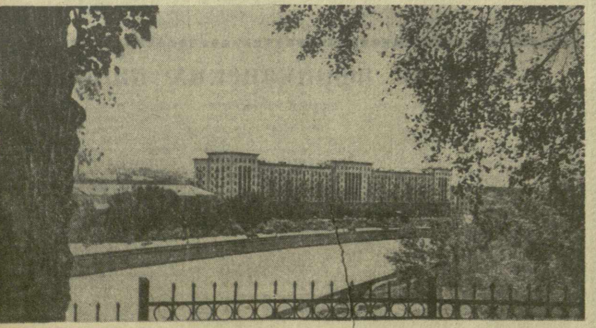
Тбилиси. Вид на набережную.

ГРУЗИНСКОМУ УПРАВЛЕНИЮ ОКЕАНИЧЕСКОГО РЫБОВОДСТВА ТРЕБУЮТСЯ РАБОТЫ НА СУДАХ ЗАТРАПЛАВАННЯ МЕДИЦИНСКИЕ РАБОТНИКИ — ВРАЧИ И ОПЫТНЫЕ ФЕЛЬДШЕРЫ ОБРАЩАТЬСЯ В ОТДЕЛ КАДРОВ ГРУЗИНСКОГО УПРАВЛЕНИЯ ОКЕАНИЧЕСКОГО РЫБОВОДСТВА ЕЖЕДНЕВНО, КРОМЕ ВОСКРЕСЕНИЯ, С 9 ДО 17 ЧАСОВ. Адрес: г. Поты, ул. Ленина, № 50 — ОКГ'ОР.