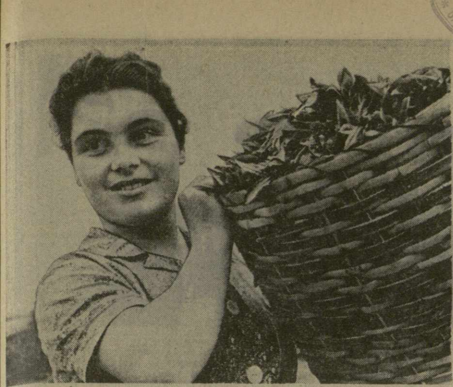
Настала горячая пора у чаеводов. Сборщики в широкополых шляпах вышли на плантации. На чайные фабрики республики непрерывно поступает зеленый лист. Чайная стра- да набирает силу.

Нынешний год у чаеводов республики особенный. Они развертывают соревнование не только за сбор высоких урожаев, но и за качество продукции. Большие задачи стоят и перед чайными фабриками республики, которым предстоит своевременно и добро- качественно переработать все поступившее сырье.