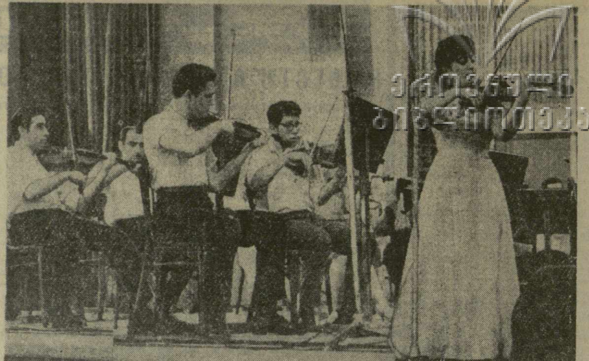
Каждый день перед гостями музыкального фестиваля братских республик Закавказья открывается прекрасный мир грузинской музыки...