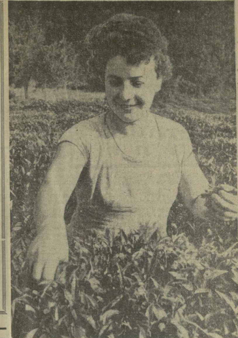
Колхоз имени Кирова села Покхо Шхавского района добился больших успехов в сборе чайного листа.