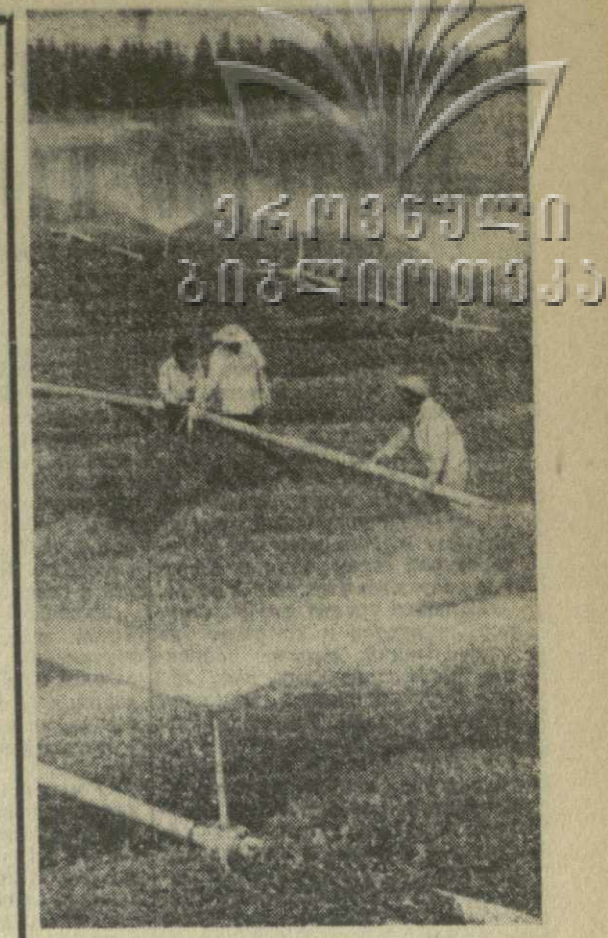
Освежающий душ принимают в эти жаркие дни 250 гектаров чайных плантаций Ачгварского совхоза в Гальском районе. Орошению плантаций дождеванием здесь уделяется большое внимание. На снимке: орошение чайных плантаций дождеванием в первом аграрном Ачгварского чайного совхоза.

Счастливого плавания, высоких уловов вам, рыбаки!