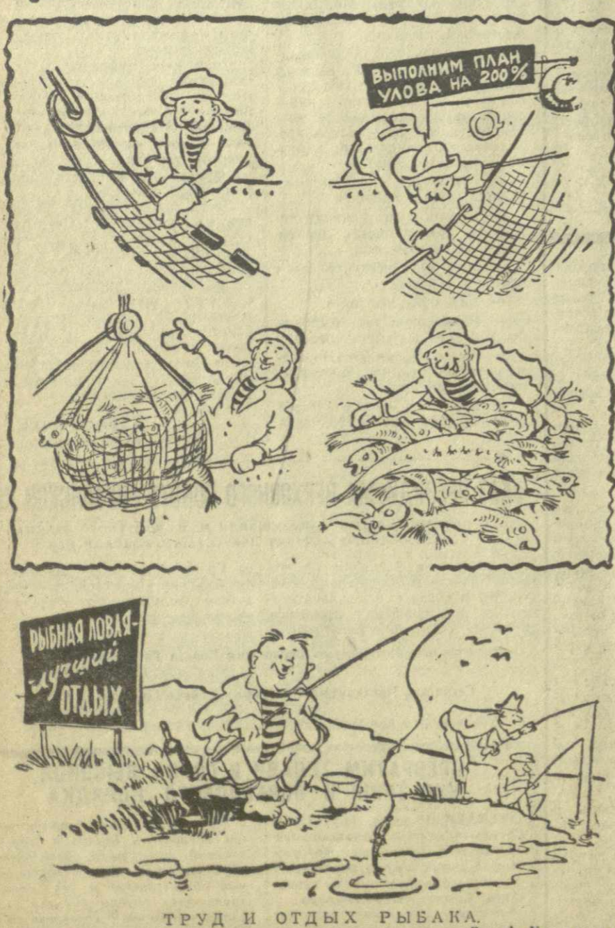
ТРУД И ОТДЫХ РЫБАКА. Рис. А. Кандеали.

В нынешнем сезоне Боржомская турбаза обслужит более 6.500 гостей.