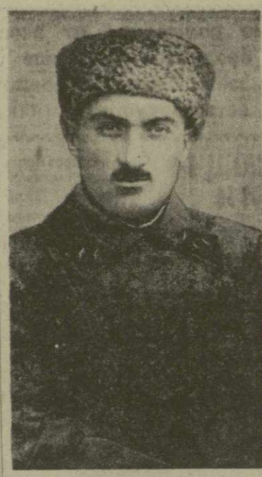
Г. Д. Кавтарадзе.

Сегодня исполняется семьдесят лет со дня рождения видного большевика Георгия Давидовича Кавтарадзе.