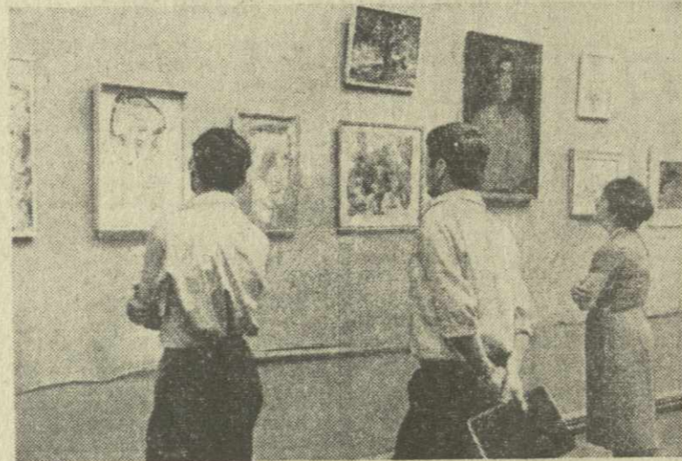
На весенней выставке художников Грузии.