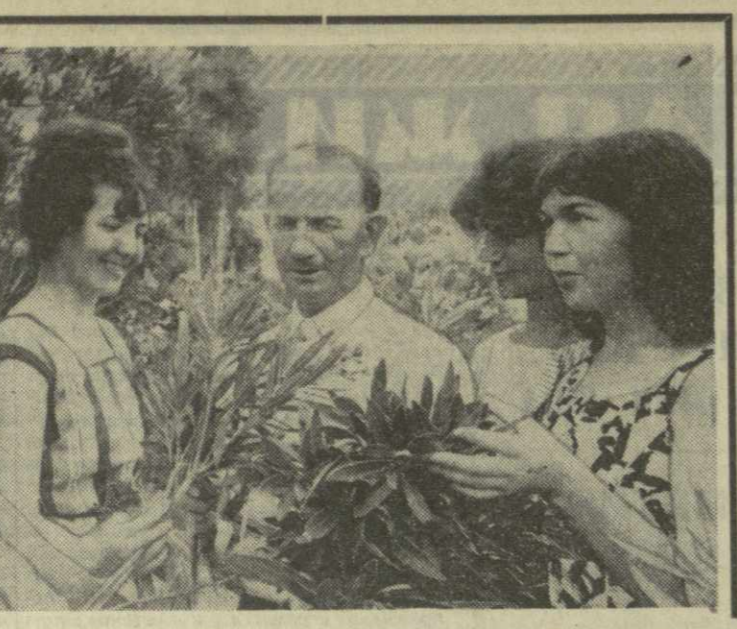
Большую и полезную работу ведет коллектив Закавказской зональной опытной станции Всесоюзного научно-исследовательского института лекарственных и ароматических растений.

И тогда остро необходима становится наука Климатологии.