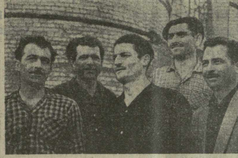
В ОТВЕТ НА ПОЧИН РУСТАВСКИХ МЕТАЛЛУРГОВ И КОЛЛЕКТИВОВ УЧЕНЫХ

Однако есть еще хозяйства, руководители которых не в полной мере используют созданные на селе благоприятные экономические условия, не уделяют должного внимания организаторской работе. Возьмем, к примеру, колхоз села Верхняя Сагарейского района. К страде здесь подготовились плохо: несвоевременно отремонтирована техника, за бригадами не закреплены определенные участки. В результате сенокос идет крайне неорганизованно. Далеко не все хозяйства используют созданные на селе благоприятные экономические условия, не уделяют должного внимания организаторской работе. Возьмем, к примеру, колхоз села Верхняя Сагарейского района.