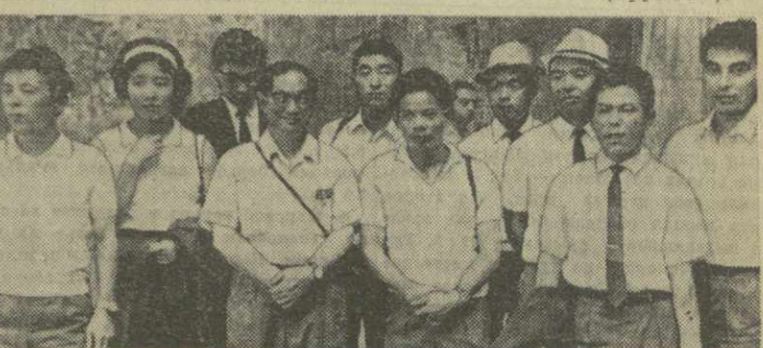
На снимке: японские альпинисты в Тбилиси.

Японские альпинисты пробыли в Грузии месяц. Совместно с грузинскими спортсменами они совершат восхождение на вершину Казбека, побывают в альпинистском лагере «Айлама», поднимутся на вершины Центрального Кавказа.