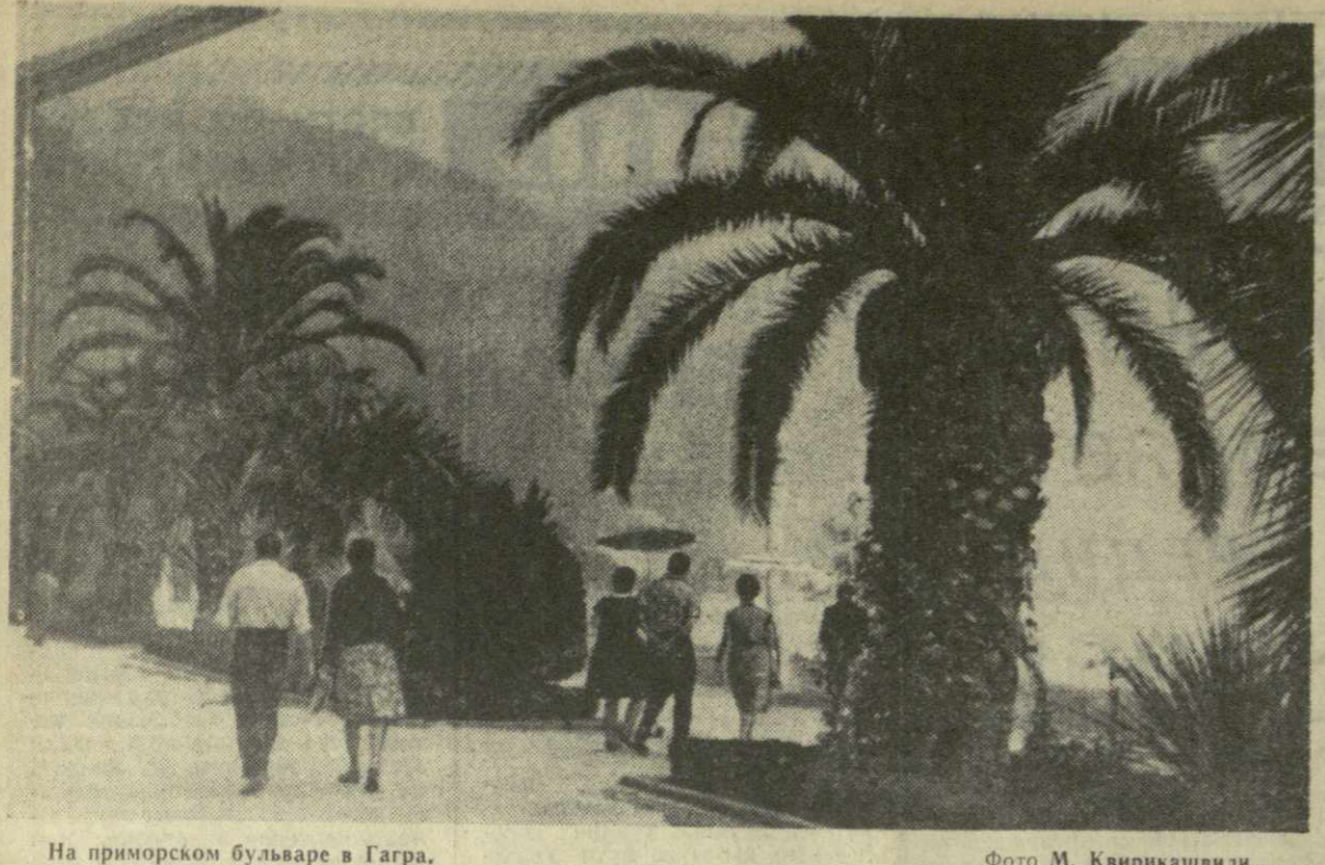
На приморском бульваре в Гагра.