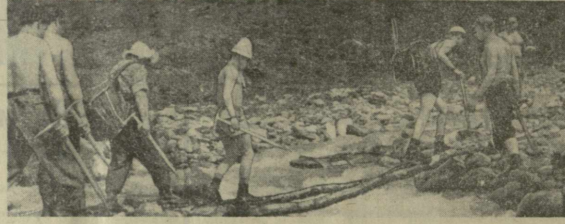
Удивительные это люди — туристы. Где только не встретишь их — в горах, в ущельях, лесах. Нагруженные рюкзаками, различный туристским снаряжением, они проходят десятки километров в день. И влетят их вперед жаждя познания природы, любовь к родной земле.

На снимке: группа туристов в ущелье реки Цхенисцкали.