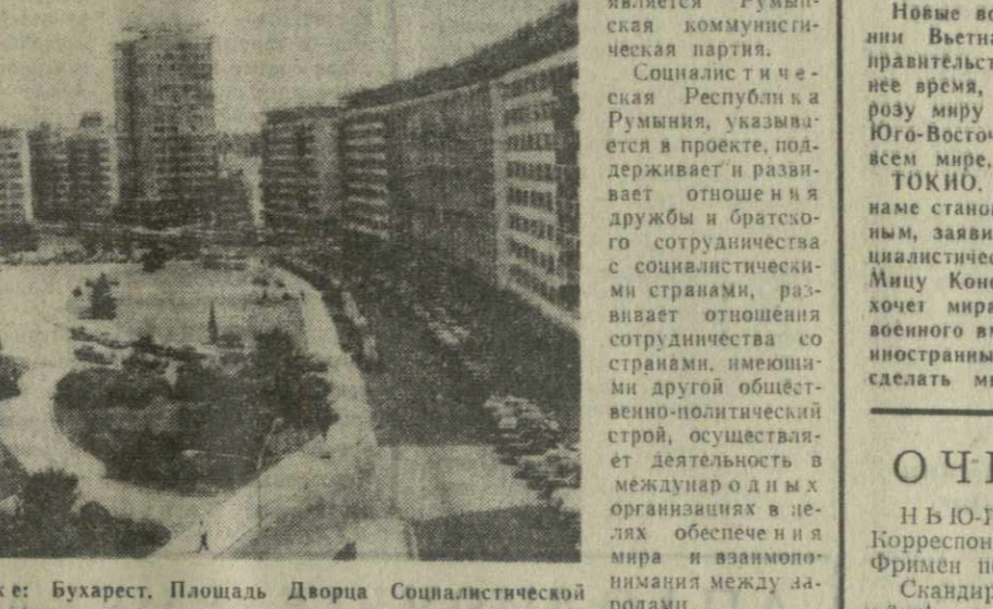
На снимке: Бухарест. Палата Дворца Социалистической Республики Румынии.

В этот день, двадцать один год назад, народ Румынии под руководством своего боевого авангарда — Коммунистической партии поднял вооруженное восстание и сверг военное-фашистскую диктатуру.