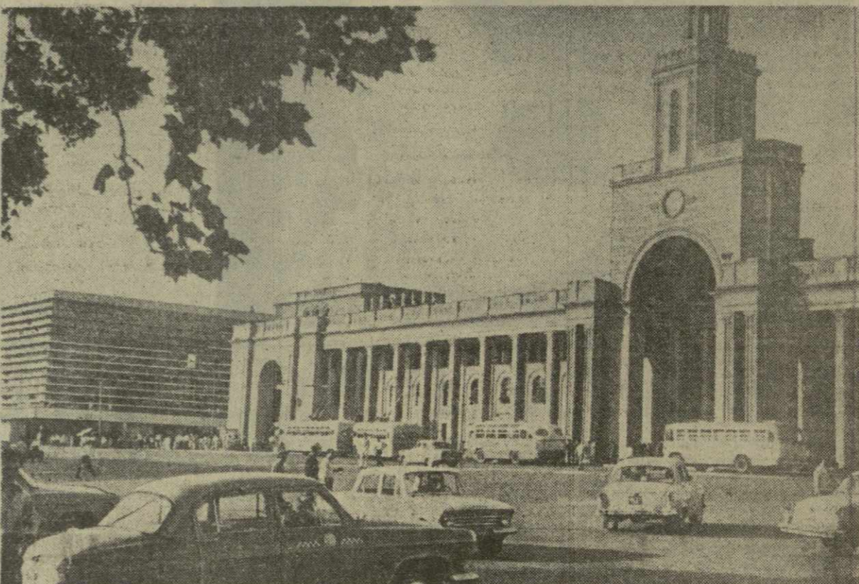
Отсюда начинается знакомство гостей столицы Грузии с городом. Сюда, на Тбилисский вокзал, ежедневно с юга и с севера прибывают поезда. Они привозят туристов и командировочных, возвращающихся домой тбилисцев.

С лекциями о Грузии выступят видные венгерские и грузинские ученые.