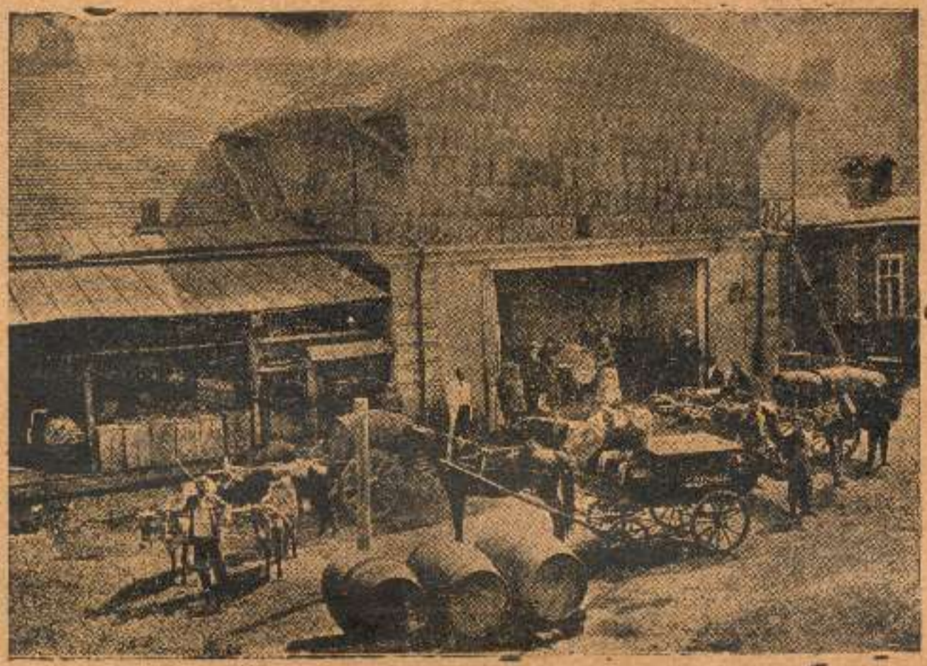
ღვო საზოგადოება „კახეთისა“: ღვინის მოტანა და გატანა

საზოგადოებას 15 წლის განმავლობაში გაუყიდა 1,000,000 ვედრო ღვინო 3,000,000 მან.