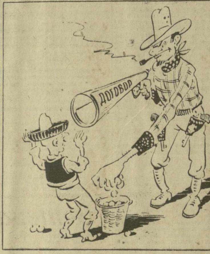
ДОГОВОР И ЕГО ЦЕЛЬ... Рис. А. Канделаки.

НЬЮ-ЙОРК. (ТАСС). Американские власти совершили новое злодеяние. В Атланте (штат Джорджия) 10 сентября вечером белые расисты, проезжавшие по негритянскому району города, обстрелили из автоматов группу негров. 16-летний юноша Губерт Варнер был убит, другой юноша — ранен.