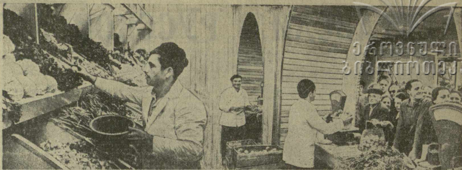
Бойко идет торговля в новом фирменном магазине Дигомского молочно-овощного совхоза на улице Кирова.