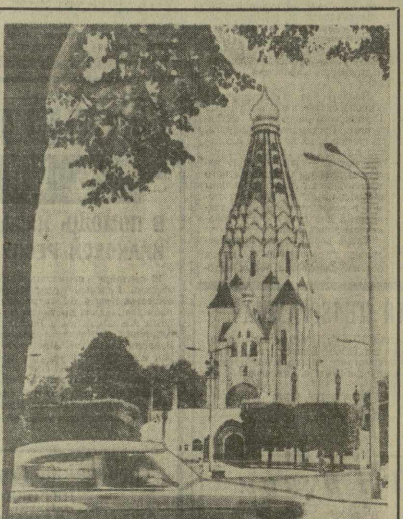
Германская Демократическая Республика. Интересной достопримечательностью города Лейпцига является эта русская церковь. Она была построена здесь в 1912—1918 годах в память о русских солдатах, павших в Лейпцигской битве народов. Русский архитектор Покровский создал ее в новгородском стиле.

НЬЮ-ЙОРК, 15 сентября. (ТАСС). Министр иностранных дел Замбия С. Капелве подверг резкой критике премьер-министра Англии Г. Вильсона, указав, что он «стремится к сохранению в Родезии правления белых фашистов». Как сообщает из Найроби корреспондент агентства ЮПИ С. Капелве, находившийся в Кении проездом с лондонской конференции премьер-министров стран Содружества, заявил также: Я думаю, что многие члены могут выйти из Содружества, не оповестив об этом.