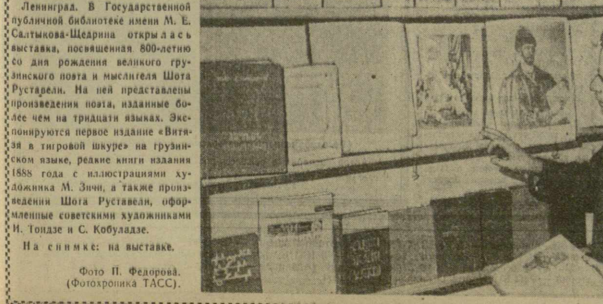
На снимке: на выставке.