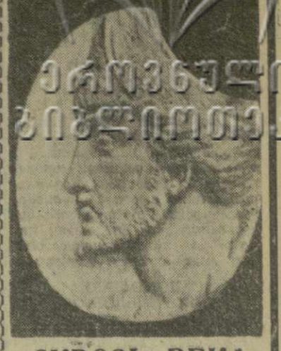
800-ЛЕТИЕ ШОТЫ РУСТАВЕЛИ