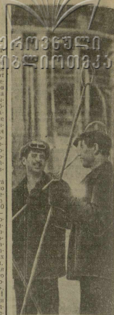
Коллектив мартеновского цеха Руставского металлургического завода выдал в нынешнем году сверх плана сотни тонн высококачественной стали.

В Горьском районе, пишет газета, орошается около 41 000 гектаров земли, занятой фруктовыми садами, сахарной свеклой, виноградниками, колосовыми, зерновыми и другими ценными культурами.