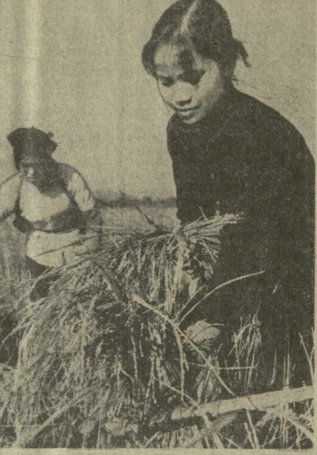
Демократическая Республика Вьетнам. Уборка раннего риса осеннего урожая в сельскохозяйственном кооперативе Тиен Хуонг в провинции Виньфу.

ВАРШАВА. 19 сентября. (ТАСС). Закрылась XVIII осенняя Познанская ярмарка. Более 7 тысяч предпринятый демонстраторов на ней свою продукцию. За неделю на ярмарке заключены торговые сделки на сумму более 35 миллиардов злотых.