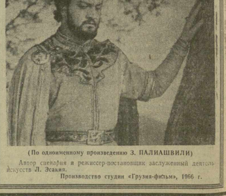
(По одноименному произведению З. ПАЛИШВИЛИ) Автор сценария и режиссер-постановщик заслуженный деятель искусств Л. Эсакии. Производство студии «Грузия-фильм», 1966 г.