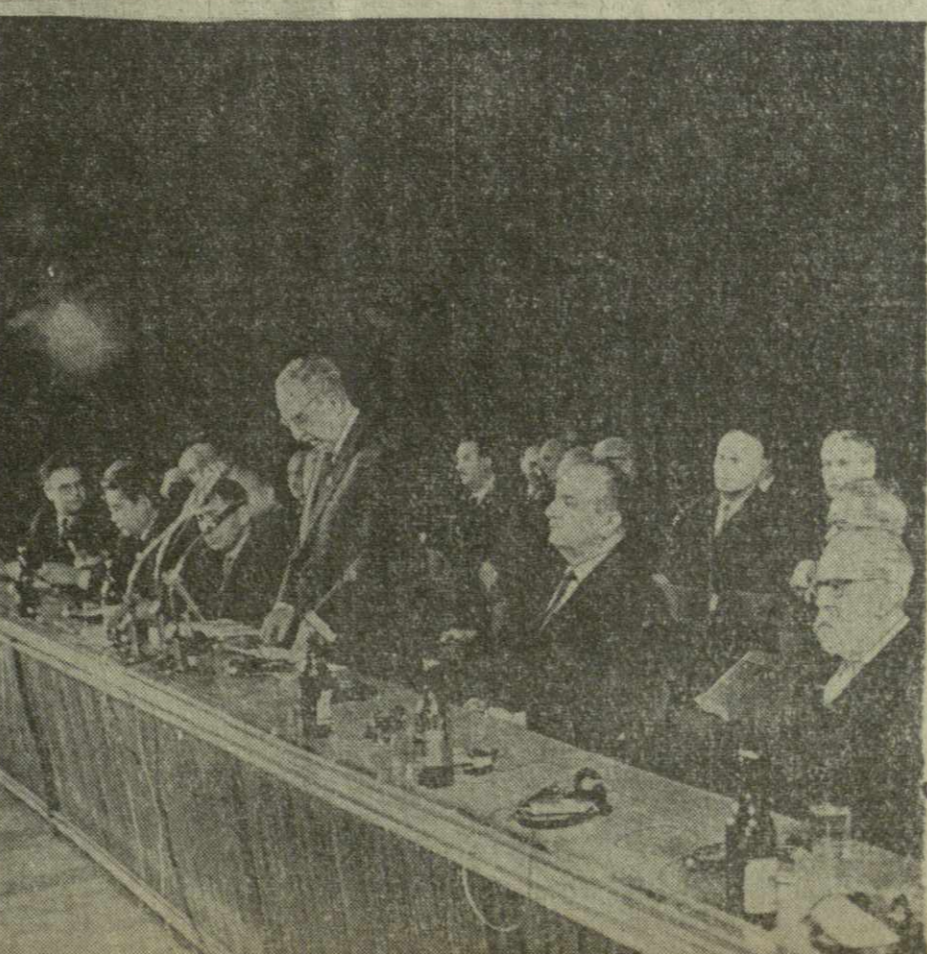
Заседание сессии общего собрания Академии наук Грузинской ССР, посвященное 800-летию со дня рождения Шота Руставели. На снимках: зал заседания и президиум сессии.