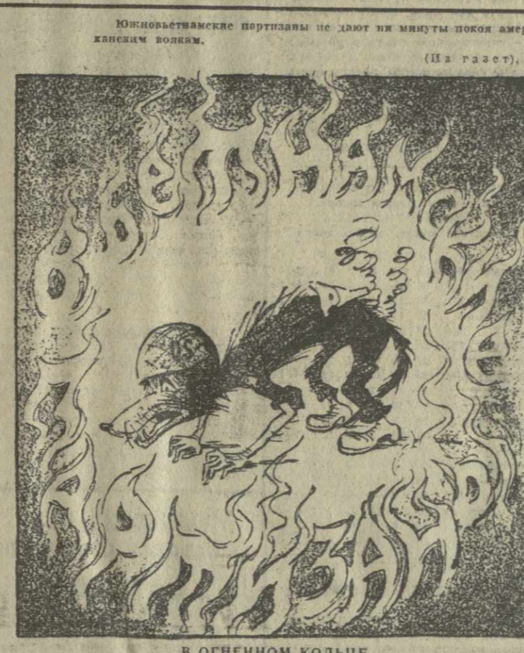
В ОГНЕННОМ КОЛЬЦЕ. Рис. М. Абрамова.