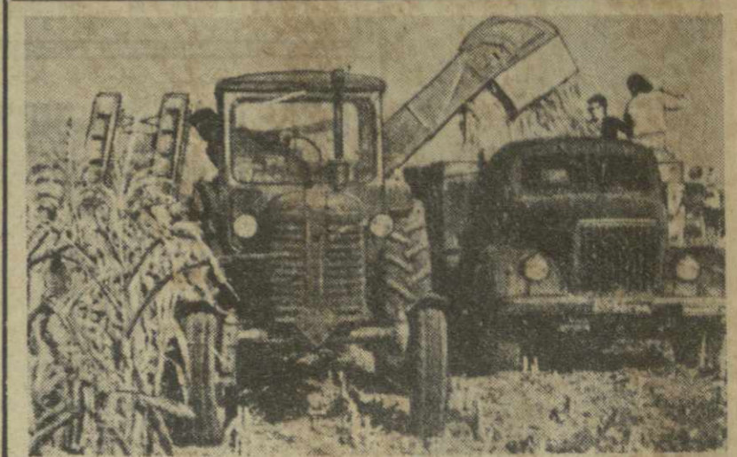
Хорошо готовится к зимовке скота животноводы сельскохозяйственной артели села Курдгалаури Телавского района. На снимке: уборка зеленой массы кукурузы на силос в колхозе села Курдгалаури.

Т. ЧХАИДЗЕ, звеньевая колхоза села Шрома Махарадзевского района, Герой Социалистического Труда.