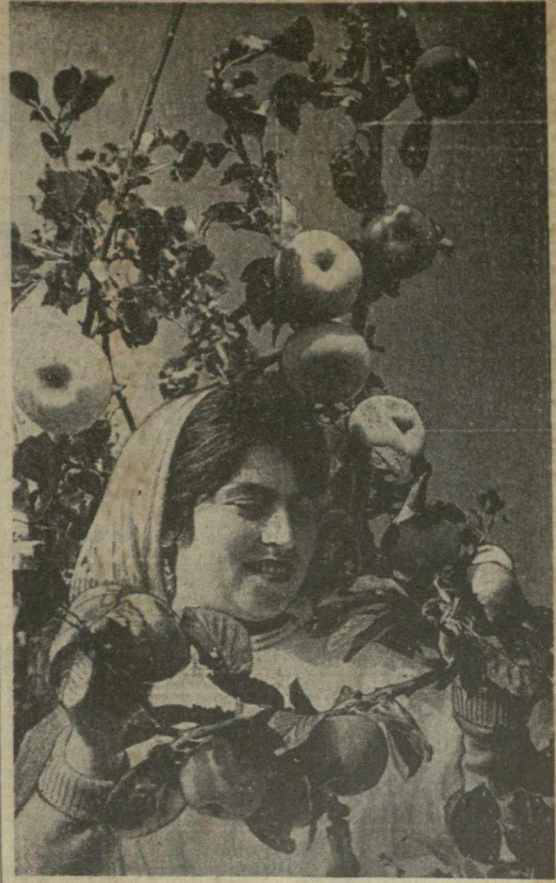
Дары осени.

СЕГОДНЯ — ВСЕСОЮЗНЫЙ ДЕНЬ РАБОТНИКОВ СЕЛЬСКОГО ХОЗЯЙСТВА