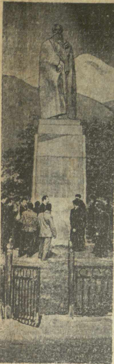
Имя классика грузинской литературы Александра Казбеги пользуется широкой популярностью в нашей стране. Земляки бережно хранят память о выдающемся мастере грузинского слова. На этом снимке вы видите почтительного таланта писателя у его памятника, установленного в Казбеги.