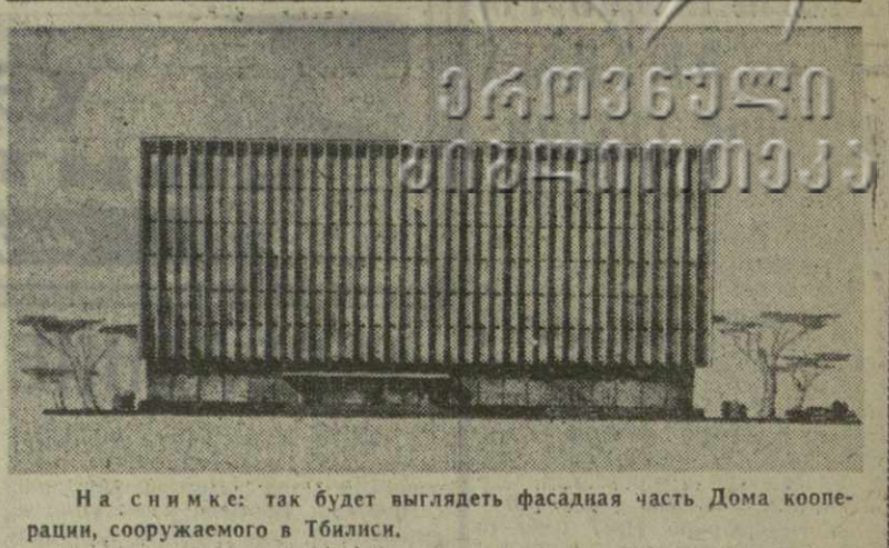
На снимке: так будет выглядеть фасадная часть Дома кооперации, сооружаемого в Тбилиси.