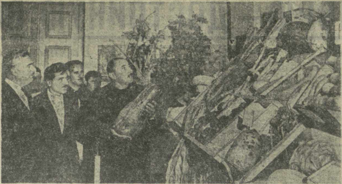
Аспидзский районный Дом культуры. Здесь часто проводятся смотры художественной самодеятельности, даются концерты, ставятся спектакли. А сегодня хозяйка Дома культуры — сельские труженики района. Они организовали выставку, которая рассказывает об успехах тружеников колхозов и совхозов района. На снимке: посетители осматривают выставку.

Интенсивно электрифицируются животноводческие фермы Кахети. (ГрузТАГ).