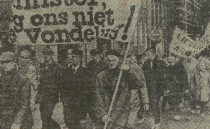
Студенты двух амстердамских университетов начали кампанию протеста против политики правительства в области образования. Значительное уменьшение стипендий заставляет тысячи учащихся искать работы и на долгие годы затягивает процесс учебы. Не продвигаясь вперед и строительство обещаний. В столице не хватает сейчас 8.000 комнат для студентов.