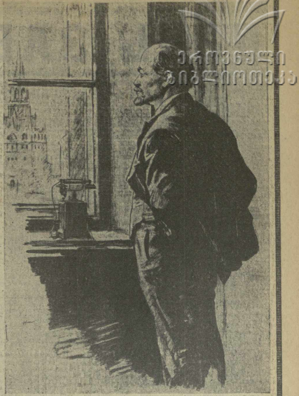
В. И. ЛЕНИН.

Сегодняшний номер „Зари Востока“ посвящен столице Союза Советских Социалистических Республик — Москве.