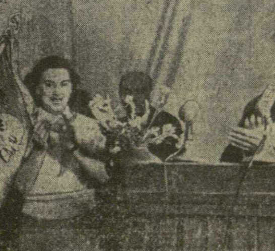
Вручение ордена Трудового Красного Знамени Тбилисскому Дворцу пионеров и школьников имени Б. Дзелядзе. На трибуне — кандидат в члены Политбюро ЦК КПСС, первый секретарь ЦК КП Грузии В. П. Мжаванадзе.

Воспитанников и коллектив Дворца пионеров и школьников