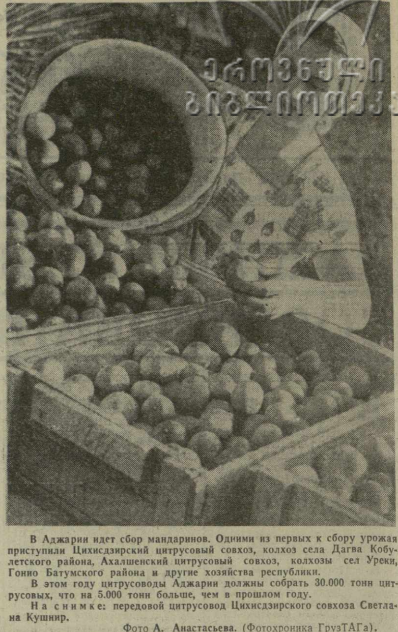
В Аджарии идет сбор мандаринов. Одним из первых к сбору урожая приступили Цихиджарский цитрусовый совхоз, колхоз села Дагва Кобулетского района, Ахалский цитрусовый совхоз, колхозы сел Уреки, Гонио Батумского района и другие хозяйства республики.

Н. ЗАКУТАШВИЛИ, колхозник хехиджарской сельхозартели Карельского района.