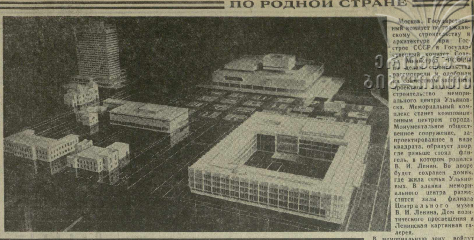
Москва. Государственный комитет по гражданскому строительству и архитектуре при Госстрое СССР и Государственный комитет Совмина Министров СССР по делам строительства рассмотрели и одобрили архитектурно-строительные проекты здания и строительства мемориального центра Ульяновска. Мемориальный комплекс станет композиционным центром города. Монументальное общественное сооружение, запроектированное в виде квадрата, образует двор, где раньше стоял флигель, в котором родился В. И. Ленин. Во дворе будет сохранен домик, где жила семья Ульяновых. В здании мемориального центра разместятся залы филиала Центрального музея В. И. Ленина, Дом политического просвещения и Ленинская картинная галерея.

Достоинно завершить выполнение заданий первого года пятилетки — почетный долг всех работников промышленности и сельского хозяйства!