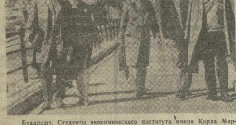
Будущие. Студенты экономического института имени Караа Марка возвращаются с занятий.

ЛОНДОН, 21 ноября. (ТАСС). Вчера здесь закончилась двухдневная конференция Лондонской организации Коммунистической партии Великобритании. Участники конференции заслушали доклад Лондонского комитета партии. Оживленные прения развернулись вокруг политического доклада, сделанного секретарем Лондонского окружного комитета КПВ Джоном Магоном. В своем докладе Дж. Магон рассказал о деятельности комитета и лондонских коммунистов, обрисовал цели и задачи, за достижение которых они борются. Он отметил авангардную роль коммунистов в борьбе