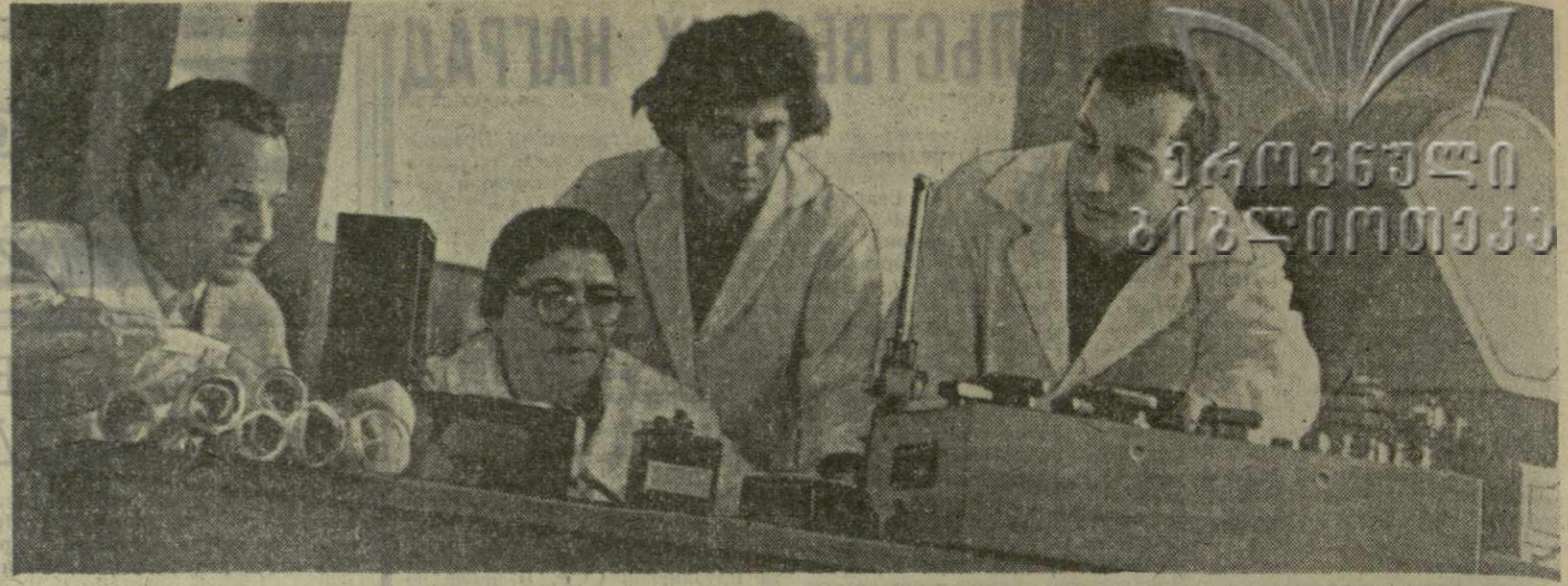
Сотрудники отдела геомагнетизма Института геофизики Академии наук Грузинской ССР проводят исследования вариаций магнитного поля Земли.

Особую заботу уделяет общество гигиеническому воспитанию учащейся молодежи и улучшению условий обучения и быта воспитанников школ-интернатов, детских домов и учащихся профессионально-технических училищ. Организаторами общества и медицинскими работниками прово-