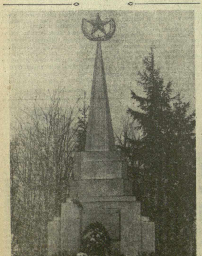
Братская могила вблизи станции Крюково на Ленинградском шоссе, из которой были взяты останки Неизвестного солдата.

Современным любителям «походов на Москву» следовало бы помнить, что в наше время СССР и другие социалистические государства располагают такой экономической и военной мощью, которая позволяет не только отразить любое нападение агрессоров, но и навсегда стереть их с лица земли.