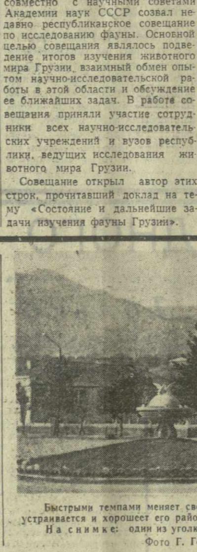
Быстрыми темпами меняет свой облик Майковский район. Благоустроенная и хорошеет его районный центр — Майковский.

Отсюда шахтеры выдают в сутки 255—266 тонн угля — на 10—15 тонн больше предусмотренного проектной мощностью. Расширяются плантации благородного лавра. Готовая к массовой заготовке лаверов, лаверов, субпродуктов хозяйства одновременно ведут закладку новых насаждений. Лаверовые плантации в Западной Грузии нынче расширяются на 623 гектара. Новым базисно-охотничьим стрелково-охотничьим типом пополняются спортивные сооружения второго индустриального центра Грузии — Кутаиси. Здесь уже проведены соревнования между спортсменами Украины и Грузии. Спортсмены дали тигру высокую оценку.