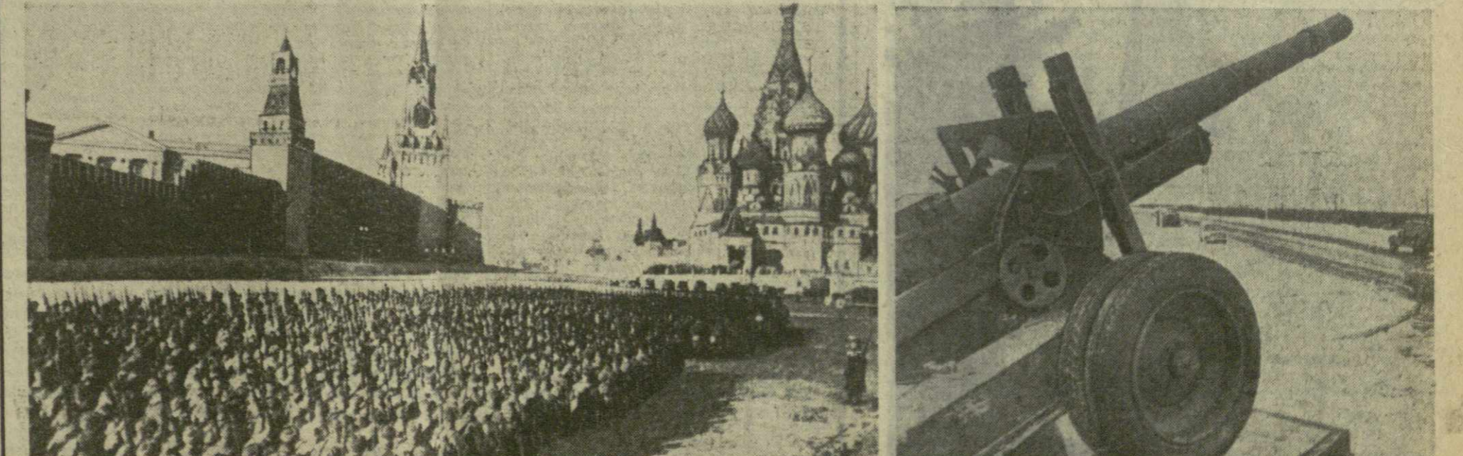
На снимках: 1. Защитники столицы направляются на фронт. 2. Под Москвой, на 75-м километре Киевского шоссе, открыт памятник боевой славы в честь 25-летия великой победы под Москвой на Наро-Фоминском направлении. Памятник боевой славы — 152-миллиметровая гаубица, установленная на постаменте. В дни боев за Москву она сгнала смерть тысяч гитлеровцев, равнявшихся к столице.