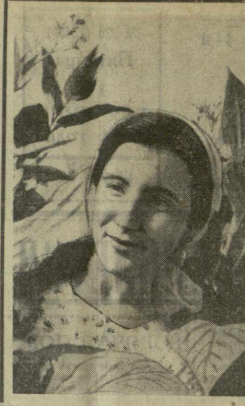
ПО СЛЕДАМ ВЫСТУПЛЕНИЯ «ЗАРИ ВОСТОКА»

Но на этом связь строителей с ВЦ не обрывается. Известно, становится непрерывным и тесно смыкается с управлением и контролем. В ИНЖЕНЕРНОЙ практике нередко возникает необходимость исследовать какой-то сложный технологический процесс. Проводить десятки, а то и сотни экспериментов на реальном оборудовании в цехах или на стройплощадках — долго, дорого, а подчас и вовсе невозможно. В таких случаях стремятся воссоздать процесс на моделях. ...На Руставском металлургическом заводе отмечались случаи простоя среднелистового прокатного стана 2.100. Происходило это из-за неудовлетворительной работы редуктора. По заданию Госкомитета черной и