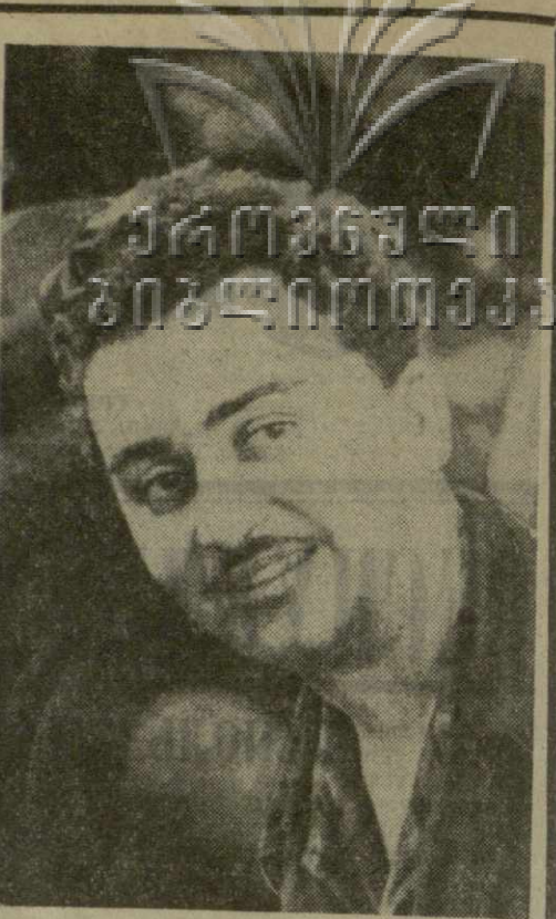
ПО СЛЕДАМ ВЫСТУПЛЕНИЯ «ЗАРИ ВОСТОКА»