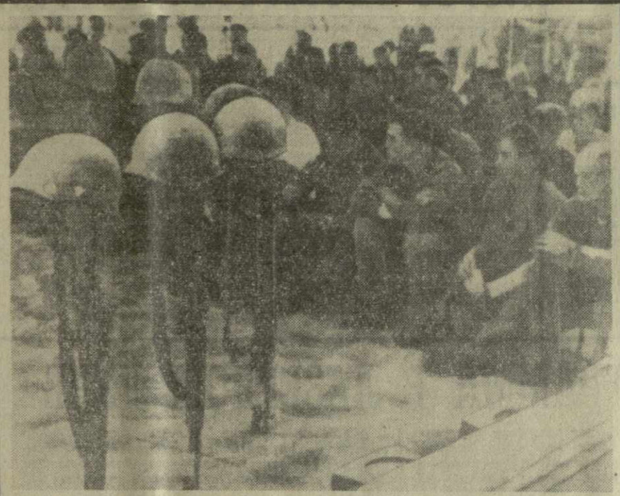
Южный Вьетнам. Еще 18 морских пехотинцев США добрались до той «последней ступеньки эскалации» во Вьетнаме, переступив которую они оставили после себя лишь карабин и каску собирая на оружие, горе и слезы — родным. На снимке: солдаты 3-го полка морской пехоты в Да-Нанге прощаются с убитыми.

Было решено продолжить контакты между двумя правительствами и обмен мнениями по проблемам, интересующим обе страны, с целью расширить уже существующее сотрудничество.