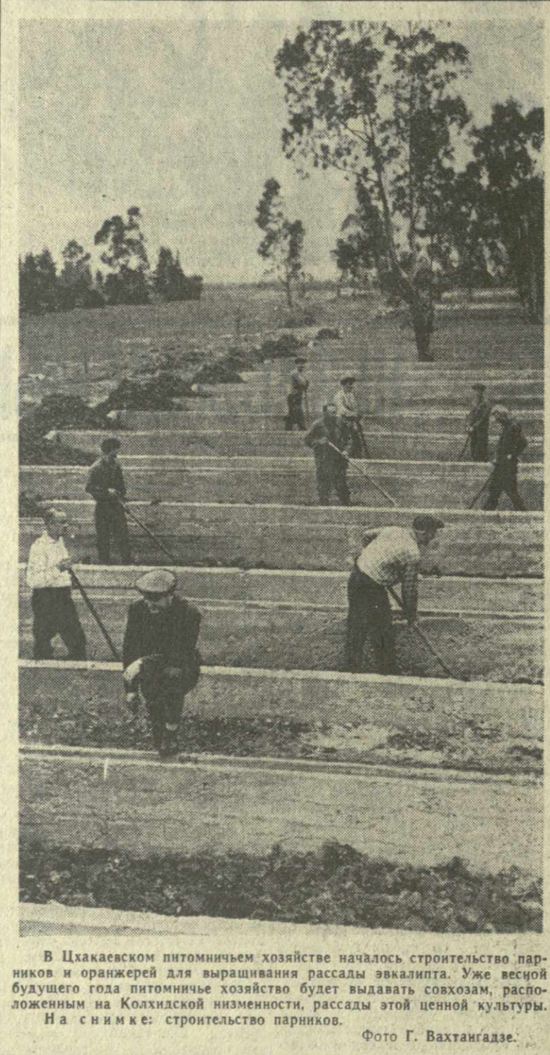
В Цхакаевском питомнике хозяйства началось строительство парника и оранжерей для выращивания рассады эвкалипта. Уже весной будущего года питомничье хозяйство будет выдавать саженцы, расположенным на Колхидской низменности, расщелины этой ценной культуры. На снимке: строительство парников.

Грузинский республиканский организационный комитет Всесоюзного фестиваля самодельного искусства, посвященного 50-летию Великой Октябрьской социалистической революции, объявил конкурс на лучшие произведения народного изобразительного и декоративно-прикладного искусства. Участники конкурса могут представить работы по живописи, графике, скульптуре, художественной обработке металла, дерева и кости, вышивке, керамике и т. п. Произведения, представленные на конкурс, должны отображать жизнь наших современников, героический труд советских людей — строителей коммунизма. Для победителей конкурса в каждом жанре установлены премии: по одной первой — 500 рублей, две вторых — по 250 рублей, три третьих — по 100 рублей. Последний срок представления работ — 20 декабря. Премированные работы будут экспонированы в Тбилиси и Москве.