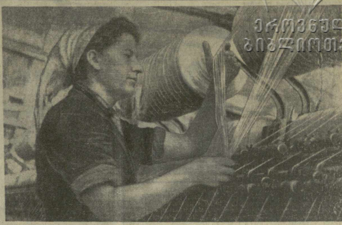
Коллектив Тбилисского камвольно-суконного комбината «Советская Грузия», соревнуясь в честь 50-летия Великого Октября, досрочно, 24 декабря, завершила программу первого года пятилетки.

РУСТАВИ. (Корр. «Заря Востока»). КОЛЛЕКТИВ РУСТАВСКОГО МЕТАЛЛУРГИЧЕСКОГО ЗАВОДА досрочно, 25 декабря, завершил выполнение годового плана по общему объему выпуска продукции.