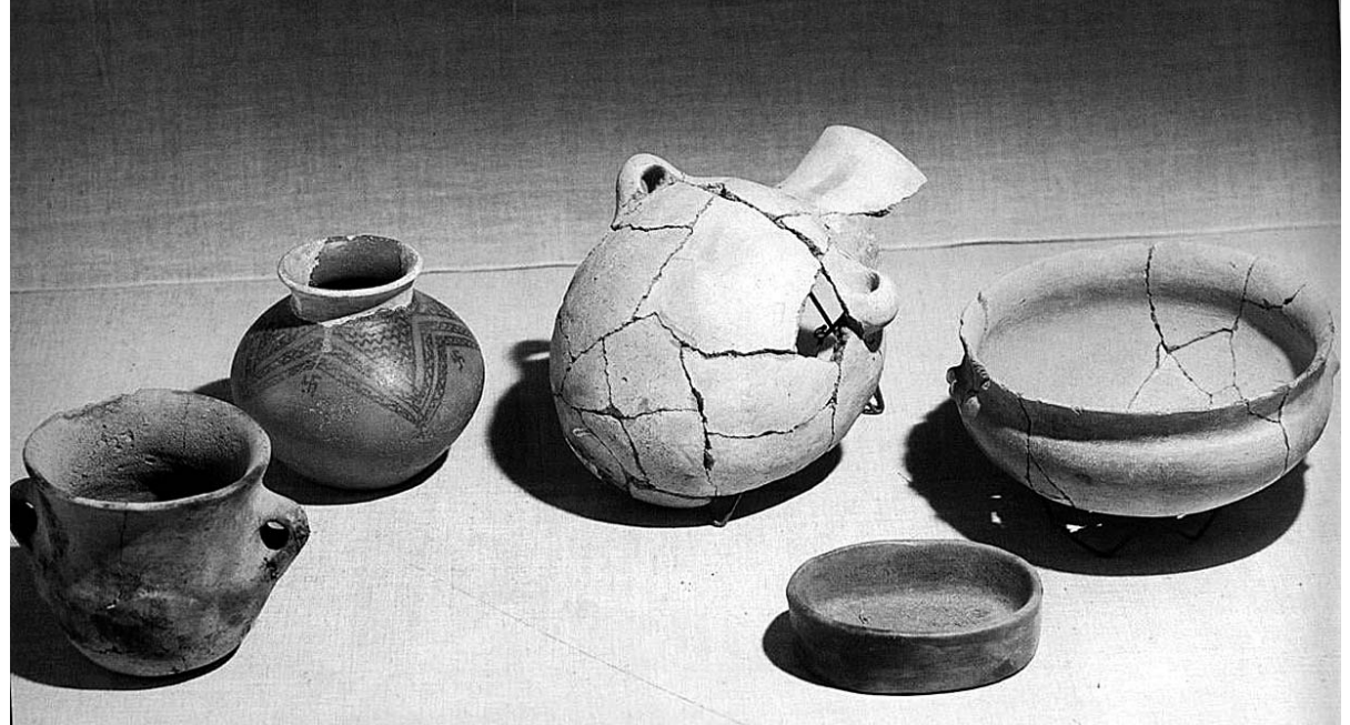
სვასტიკა ქართულ თიხის ქოთანზე კვ. II ათასწლეული.