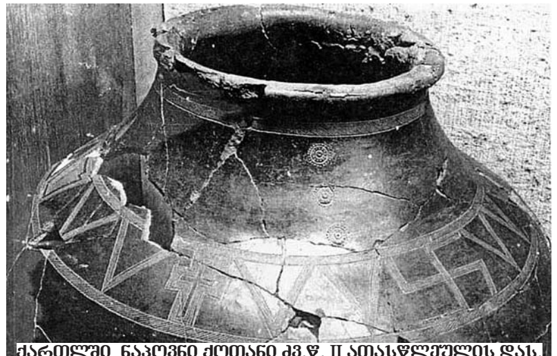
ქართული ნაპოვნი ქოთანი კვ. II ათასწლეულის დას.

საქართველოში ყველაზე გავრცელებული იყო 7-ქიმიანი ბორჯღაღა, კოსმოსის სიმბოლური განსახიერება, ქრისტიანობამდელ ქართულ პანთეონში არსებული შვიდი წმინდა მნათობის ხატოვანი ნიშნები. კონცენტრაციის ცენტრი, „ბურჯი“, საიდანაც თითოეული „ღაღა“ (მნათობი) გამოდინება, ღმერთის საგანეს სიმბოლოდ მიიჩნეოდა, ყოველივე ხილულისა და უხილავის შემოქმედად (მთოვარე — ყამარ — მთვარე; ჯუმა — ერმი, ოტარიდი — მერკური; მთიები — ცისკრის ვარსკვლავი — ვენერა, აფროდიტე, იშტარი; მარი-