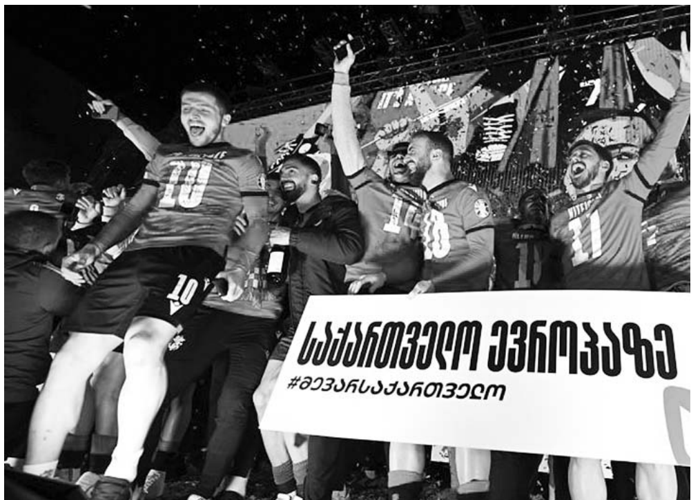
ადამიანი ხარ. ისინი ქვეყნის მტრები არიან, თქვენ კი პატრიოტები ხართ და ასეთ პირობებში, მათი თქვენთან დაპირისპირება სრულიად ბუნებრივი მოვლენაა.

ჩვენს საამაყო ფეხბურთელებს არ უნდა ეწყინოთ არცერთი ბოღმიანი სიტყვა, რომელიც ლიბერალურ-ფაშისტურმა უმცირესობამ მათ სრულიად ბუნებრივ მადლიერებას დაუპირისპირა. როდესაც ქვეყნის მტერი გლანძღავს, ეს ნიშნავს, რომ სწორად იქცევი და სწორი