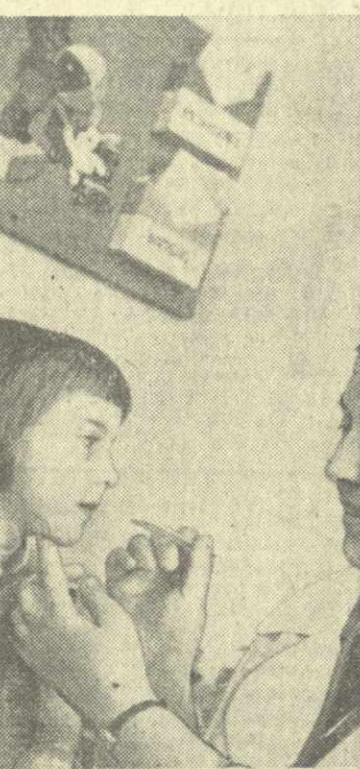
Чуткое и ласковое отношение к своим маленьким пациентам проявляет коллектив тбилисской 11-й детской поликлиники района имени Орджоникидзе.