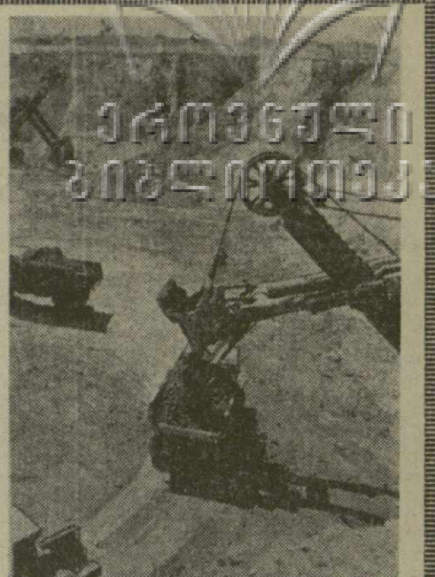
На крайнем востоке Казахстана возник крупный индустриальный центр. Толчок промышленному развитию края дал обнаруженный здесь богатейшие запасы полиметаллических руд. Настоящим кладом природы является Николаевское полиметаллическое месторождение, из руд которого можно получать медь, цинк, золото, серебро, серную кислоту.