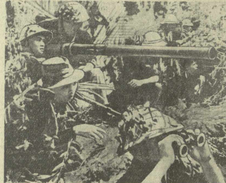
Освободительная армия Южного Вьетнама растет и крепнет в боях. Вооруженные трофейным оружием, захваченным у марionеточных войск, патриоты наносят мощные удары по врагу. На снимке: патриоты в засаде.