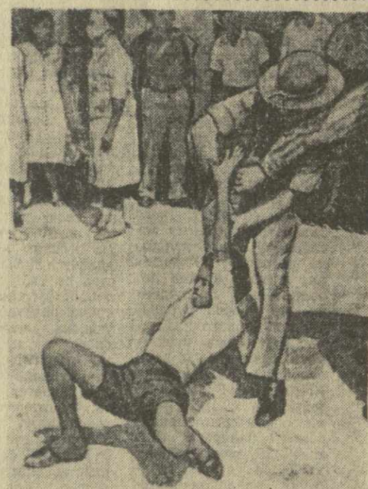
Во многих городах Соединенных Штатов Америки проходят демонстрации в защиту гражданских прав негритянского населения.

собрался сегодня на чрезвычайное заседание для рассмотрения опасного положения в Южной Родезии, созданного политикой режима Смита превратить эту страну в расисткое государство по образцу Южно-Африканской Республики. Министр иностранных дел Англии Майкл Стюарт, специально пригласенный в Нью-Йорк на сегодняшнее заседание, сообщил Совету о предпринимаемых правительством Вильсона шагах. Перечислив экономические санкции, к которым решил прибегнуть Англия, в частности прекращение импорта табака и сахара из Южной Родезии, Стюарт указал, что табак и сахар дают 1/3 общей выручки Южной Родезии от экспорта на мировой рынок. Стюарт выразил надежду, что Совет Безопасности и члены ООН будут действовать эффективно применяемые Англией меры. Однако он дал ясно понять, что англий-