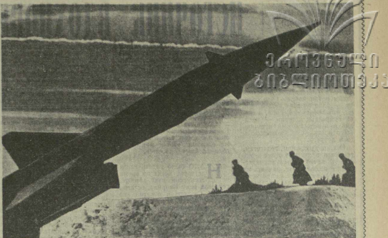
Смотрят в мирное небо ракеты — величавы, грозны и сильны. Часовые покая планеты, — стражи чистого неба страны. Им Отчизна набрала высоты, чтобы быть обгоняла мечту,

Отмечая День ракетных войск и артиллерии, воины нашего округа, горко стоящие на защите южных рубежей нашей Родины, вместе со всем советским народом еще теснее сплачиваются вокруг своей родной Коммунистической партии и ее Ленинского Центрального Комитета. Они готовы сокрушить любого агрессора, который попытается нарушить мирный создательный труд советского народа.