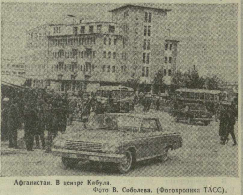
Афганистан. В центре Кабула.

ПАРИЖ, 18 ноября. (ТАСС). Более 200 учащихся африканской средней школы в Гваело (пригород Солсбери) были публично подвергнуты порке розгами и палками южно-родезийскими палачами за участие в демонстрации протеста против одностороннего провозглашения независимости Южной Родезии. Как сообщает корреспондент агентства Франс Пресс из Гваело, учащиеся этой школы с лозунгом «Долой Смита!» намеревались пройти в центр Солсбери, однако были задержаны полицейским кордоном.