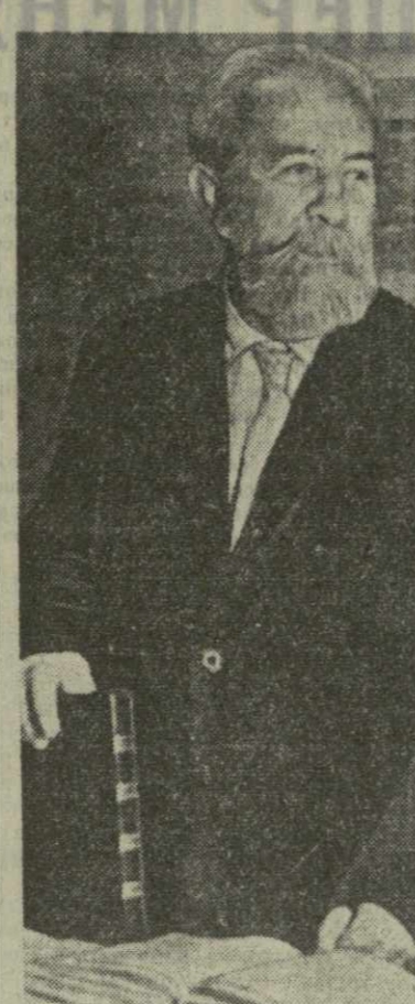
Один из самых выдающихся советских историков искусства, директор Института истории грузинского искусства, академик Академии наук Грузинской ССР, Георгий Николаевич Чубинашвили принадлежит к замечательной плеяде грузинских ученых и общественных деятелей — зачинателей советской грузинской науки. Более полувека своей жизни отдал он науке. Его труды заложили прочный фундамент истории грузинского искусства как научной дисциплины. Он воспитал несколько поколений грузинских художников, скульпторов, архитекторов, историков искусства. Последние 45 лет Г. Н. Чубинашвили руководит всеми значительными мероприятиями в области охраны памятников искусства, активно участвует в организации музейного дела, устройстве выставок грузинского искусства. В качестве руководителя института он принимает активное участие в изучении и разработке вопросов грузинского советского искусства, всегда горячо интересуется творчеством молодых мастеров.

Роль трудов Г. Н. Чубинашвили в изучении и развитии грузинского искусства в трудные перемены их значение выходит далеко за пределы собственно истории искусства, они освещают немало общих вопросов истории грузинского народа. Г. Н. Чубинашвили — признанный авторитет и в области искусства Армении и всего Переднего Востока.