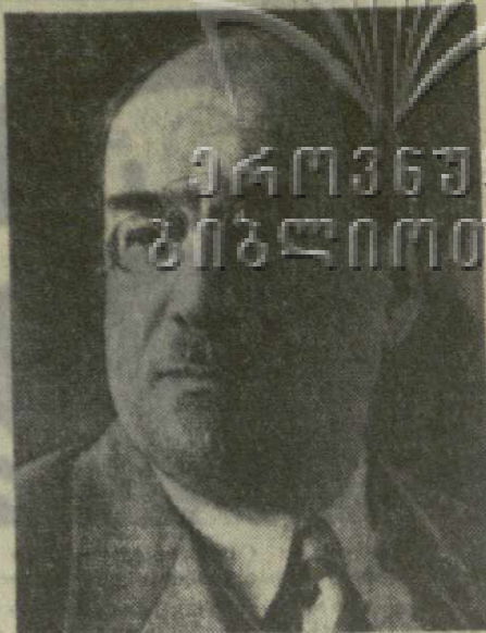
А. В. Луначарский.