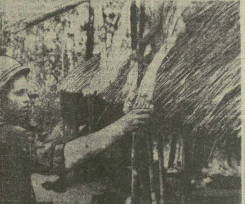
Поджигатель... Точно так же гитлеровцы в годы второй мировой войны уничтожали на временно оккупированной ими территории жилища мирных жителей, создавая «зону выжженной земли».

ЦЕНТРАЛЬНЫЙ КОМИТЕТ КОМПАРТИИ ГРУЗИИ СОВЕТ МИНИСТРОВ ГРУЗИНСКОЙ ССР