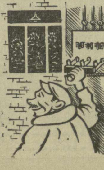
Рис. В. Чернышева.