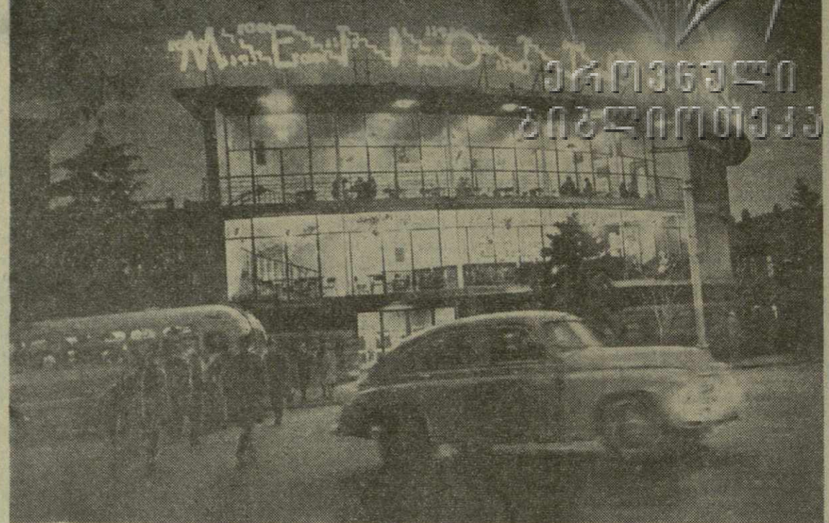
На снимке: у кафе «Метро» в вечерний час.

ческих препаратов, ионизирующего облучения, а также введение больших доз крови, клеток селезенки и лимфатических узлов, костного мозга. Опыт с Лиской интересен тем, что сразу же после операции ей стали вводить хорошо известные и применяемые в клиниках при целом ряде заболеваний препараты б-меркаптопурина и преднизолон. Они препятствовали выработке антител и позволили преодолеть тканевую несовместимость. Теперь хирурги хотят пересадить кишку непосредственно в брюшную полость, заместив удаленный отрезок кишки. Кошачья цель исследований — передать новые методы в клинику. Перспективы весьма заманчивы: можно будет радикальным образом бороться с такими тяжелыми состояниями, как кишечная непроходимость, тотальный заворот кишок и другие заболевания. А пока лаборатория в тесном контакте с кафедрой оперативной хирургии Университета дружно народов имени Дзугмабы продолжает накапливать опыт для будущих операций.