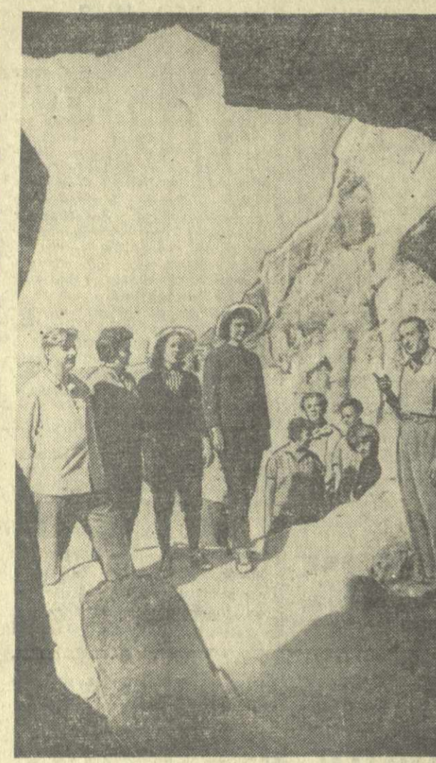
Много туристов и экскурсантов привлекает пещерный монастырь Вардзиа. На снимке: туристы за осмотром исторических мест Вардзиа.